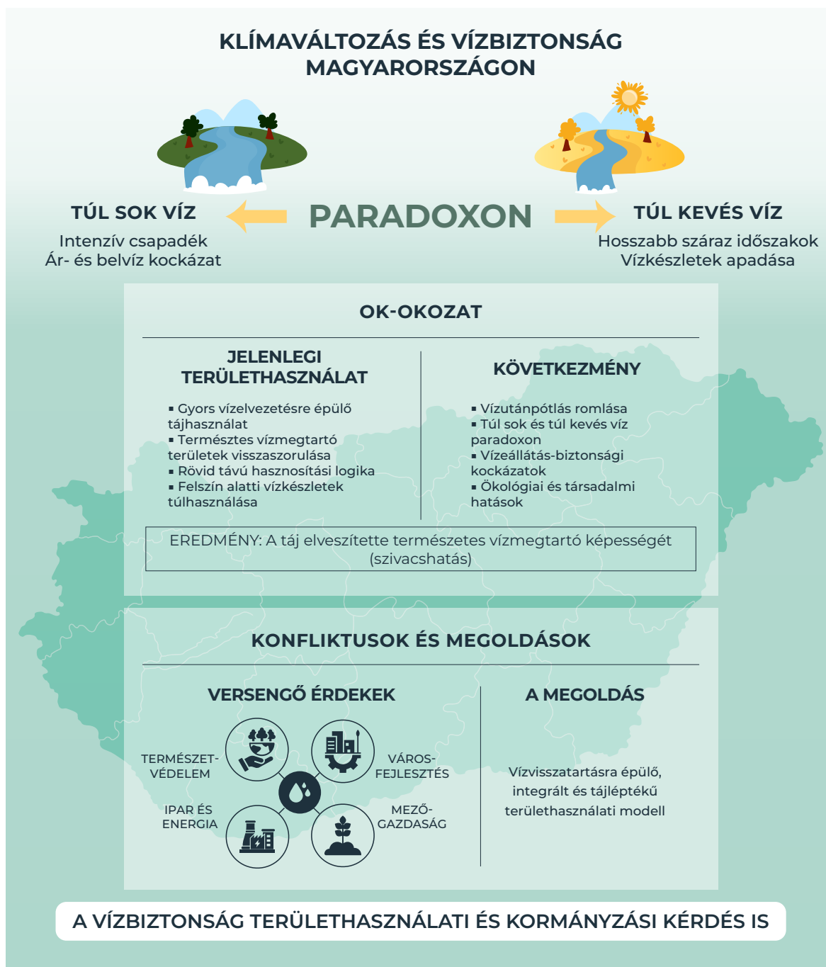
► 4. ábra: Klímaváltozás és vízbiztonság Magyarországon