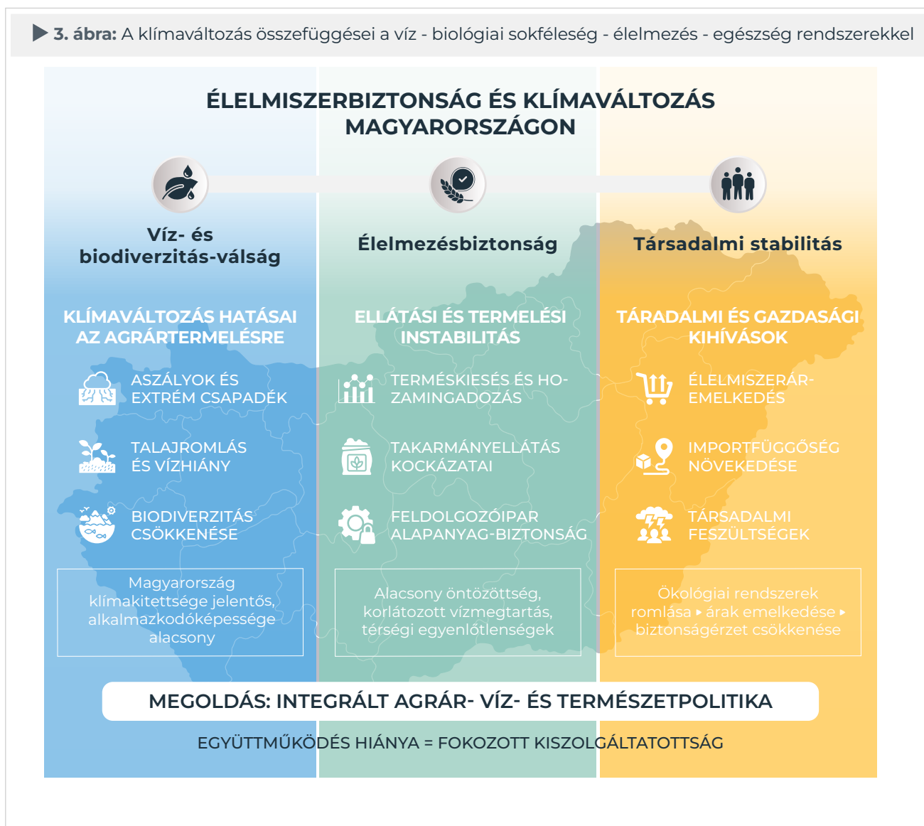
► 3. ábra: A klímaváltozás összefüggései a víz - biológiai sokféleség - élelmezés - egészség rendszerekkel