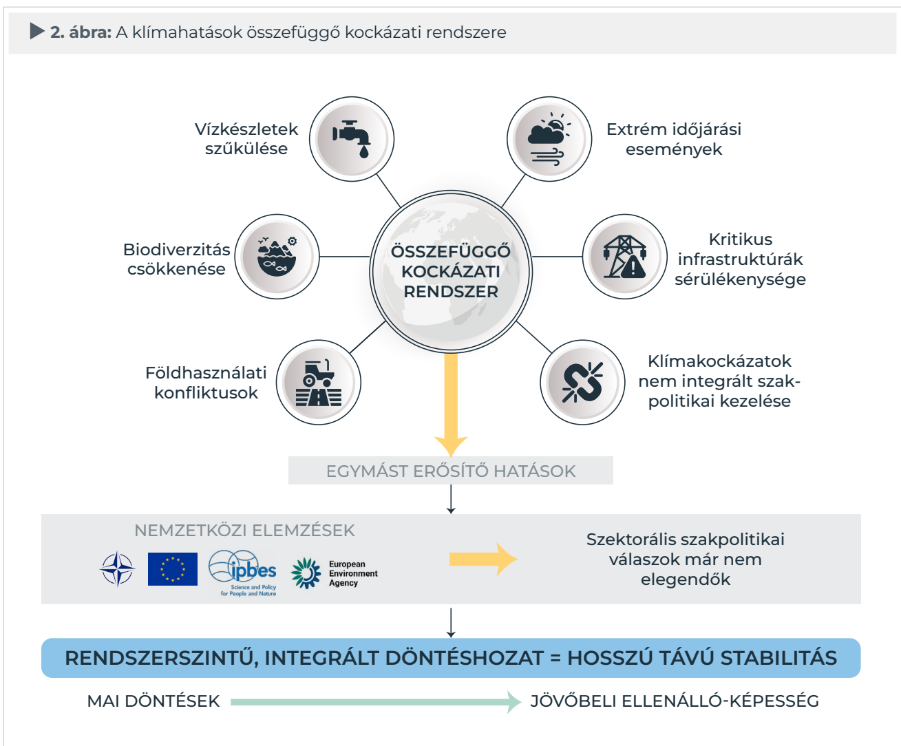
► 2. ábra: A klímahatások összefüggő kockázati rendszere

A klímaváltozás biztonsági következményei már jelen vannak, és a jövőben tovább erősödnek. A döntések, amelyek ma születnek az infrastruktúra-fejlesztés, a területhasználat vagy a természeti erőforrások kezelése terén, évtizedekre meghatározzák az ország kitettségét és ellenálló-képességét. A holisztikus, integrált megközelítés nem elméleti elvárás, hanem a biztonságpolitika és a hosszú távú társadalmi stabilitás egyik alapfeltétele.